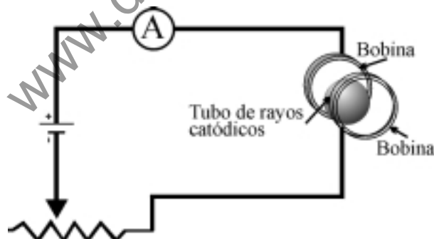
Figura 2: Circuito del dispositivo empleado.

manera, los electrones emitidos alcanzan una cierta velocidad dependiente del potencial acelerador.